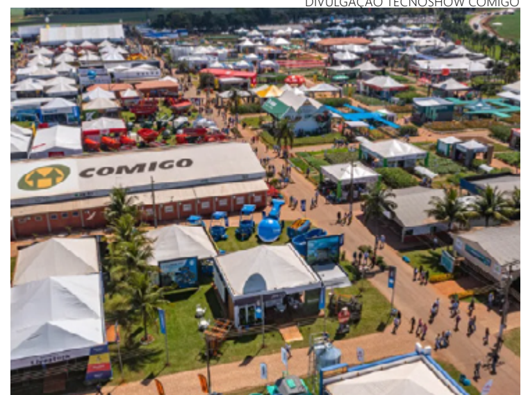
Palestra foi realizada na Tecnoshow em Rio Verde, região do Sudoeste Goiano, encerrada na semana passada