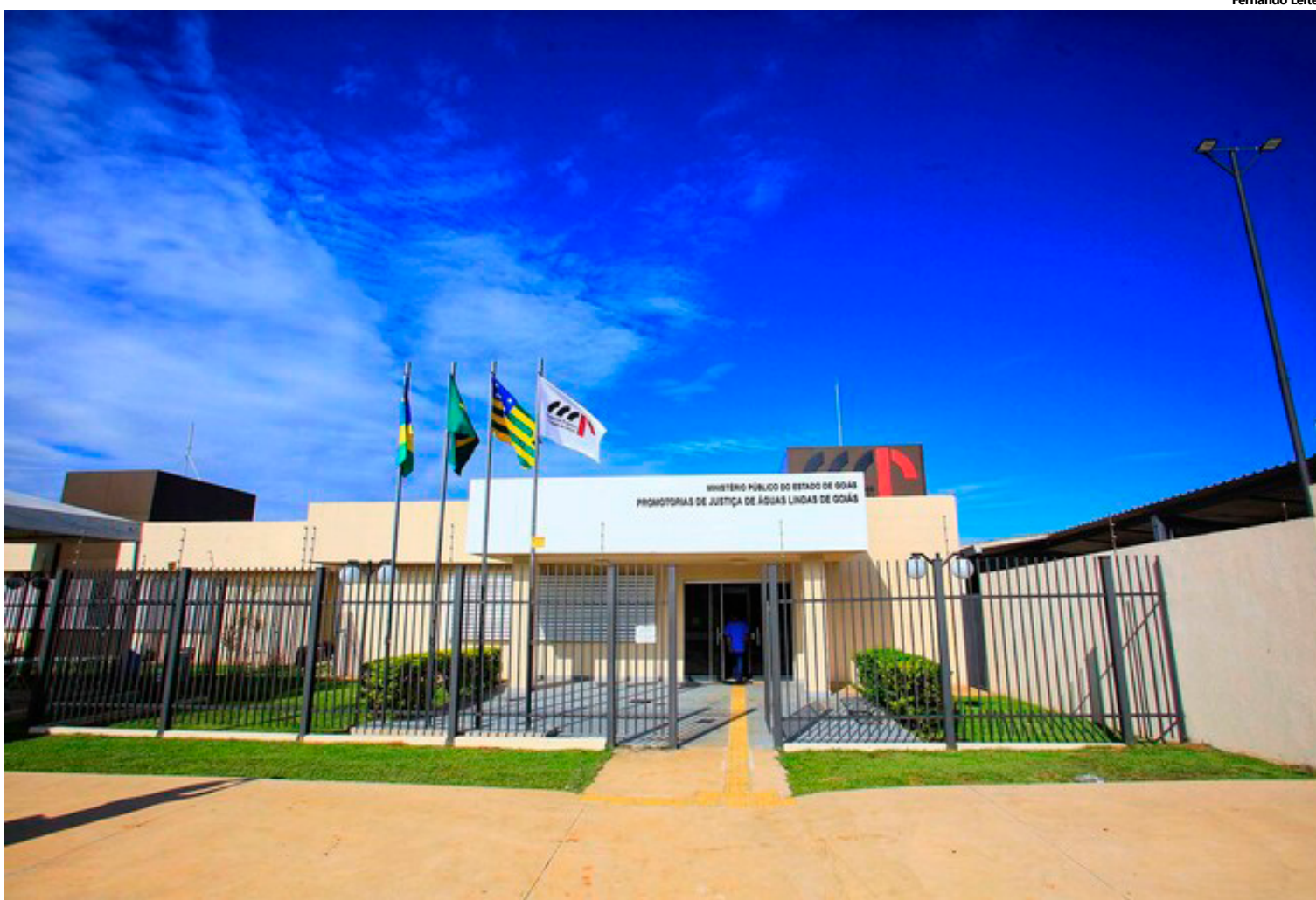
A nova estrutura vem atender às necessidades da comarca, que conta hoje com oito promotorias de Justiça instaladas.

A chuva também marcou presença durante a cerimônia de inauguração das obras de ampliação e reforma da sede do MPGO em Águas Lindas de Goiás. Aguardada com ansiedade por membras (os), servidoras (es) e população em geral, a nova estrutura vem atender às necessidades da comarca, que conta hoje com oito promotorias de Justiça instaladas.