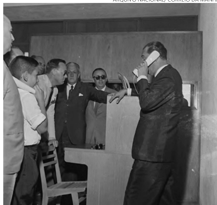
JK e o príncipe Bernhard de Lippe-Biesterfeld, dos Países Baixos, inauguram o serviço telefônico em Brasília, em 1959

Conforme documentos do TRE-GO, o político ainda se elegeu Senador por Goiás, antes de ser cassado pela ditadura, instaurada em 1964. Juscelino Kubitschek morreu em 1976 e, de acordo com relatório da Comissão Nacional da Verdade, ele teria sofrido um "atentado político". JK estava num Opala guiado pelo motorista Geraldo Ribeiro. O carro bateu numa carreta na Via Dutra, na altura de Resende, no Rio de Janeiro. Ambos faleceram na hora.