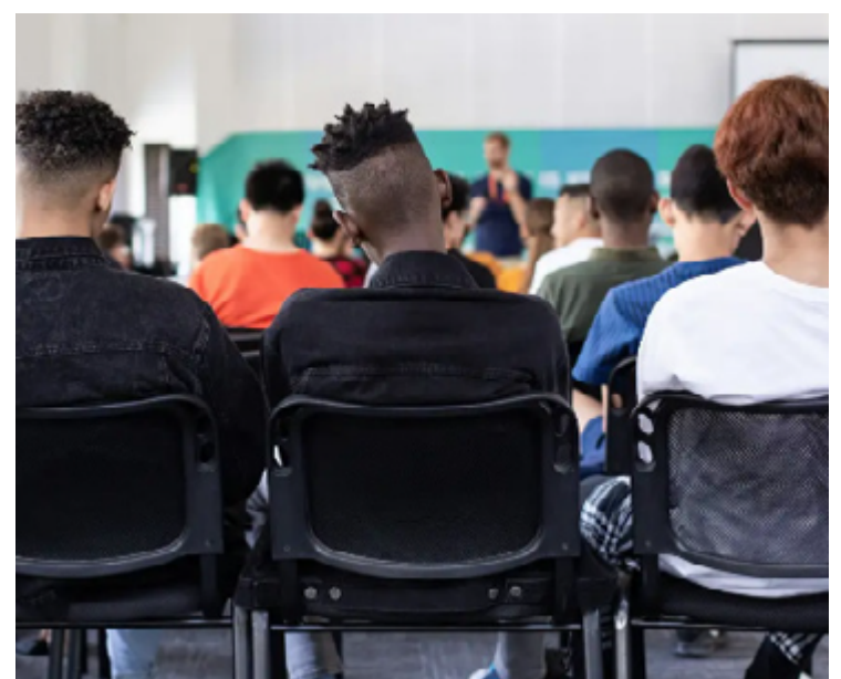
Metade das unidades educacionais onde negro estudam não tem biblioteca e sala de informática

trutura escolar: diferenças entre escolas brancas e negras foi elaborado com dados do Censo Escolar e do Indicador de Nível Socioeconômico (Inse).