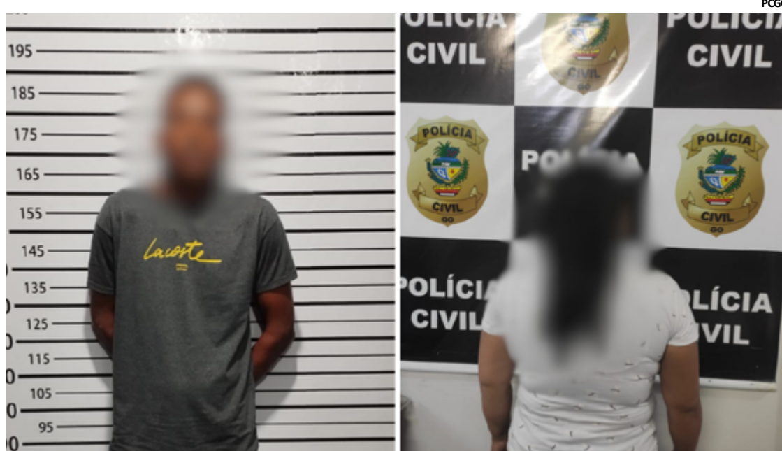
Ambos os suspeitos estão à disposição do Poder Judiciário para os procedimentos legais necessários.

O primeiro caso remonta a setembro de 2021. Segundo as investigações, o suspeito e a vítima compartilhavam o hábito de consumir bebidas alcoólicas juntos, porém, em determinadas ocasiões, a vítima, de forma brincalhona, costumava desferir tapas na cabeça do investigado, o que o incomodava profundamente. Em um desses episódios, o investigado, irritado, armou-se com uma faca e desferiu golpes na vítima, causando-lhe ferimentos graves