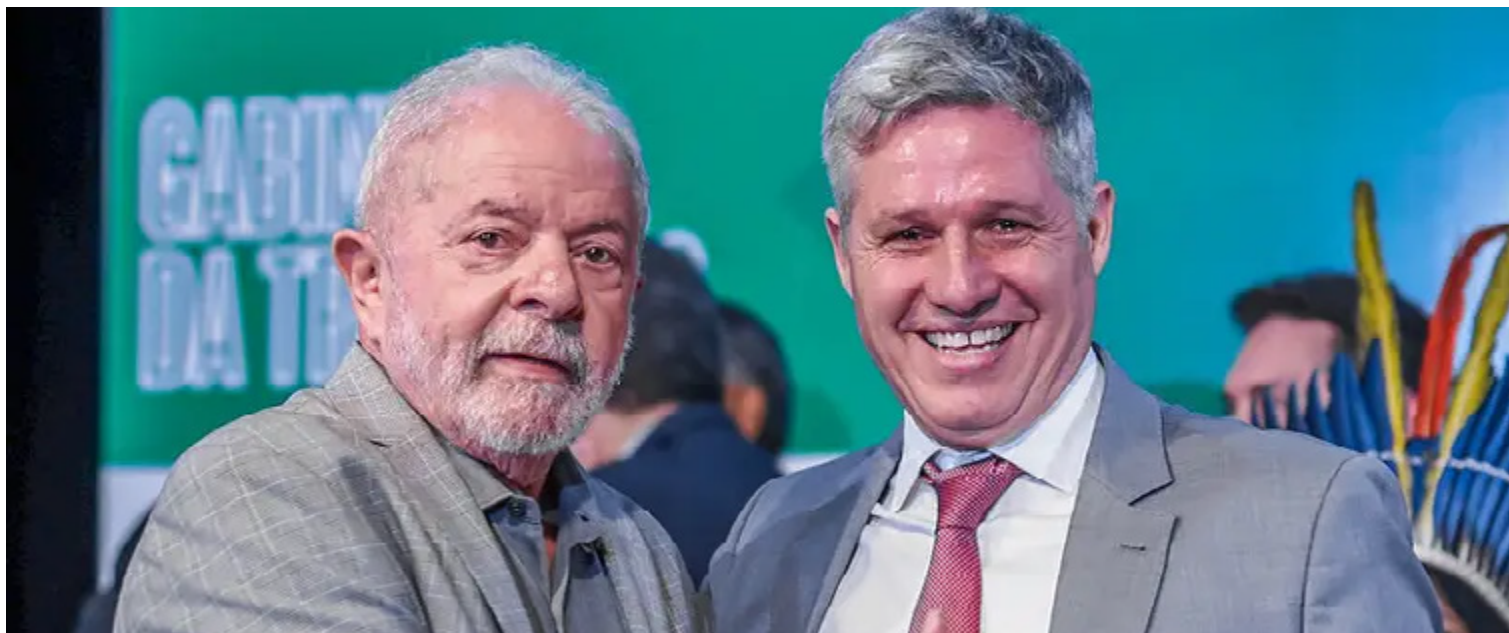
Lula da Silva e Paulo Teixeira: compromisso com a reforma agrária no país

A invasão em Pernambuco deste domingo (14) faz parte do total de 24 ações em 11 estados brasileiros do MST, segundo dados do movimento nesta segunda, com mais de 20 mil famílias.