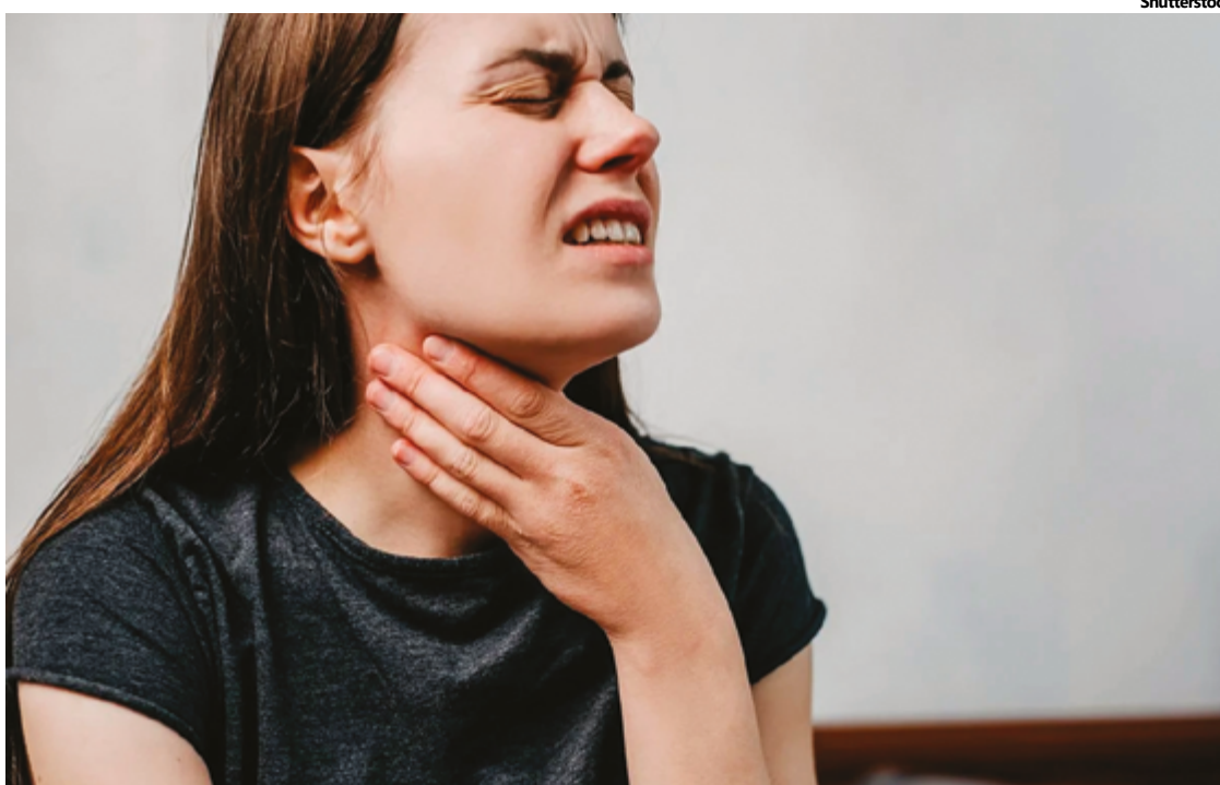
Segundo especialista, até mesmo a roupa utilizada em um momento que o indivíduo vai fazer um maior esforço vocal interfere na saúde