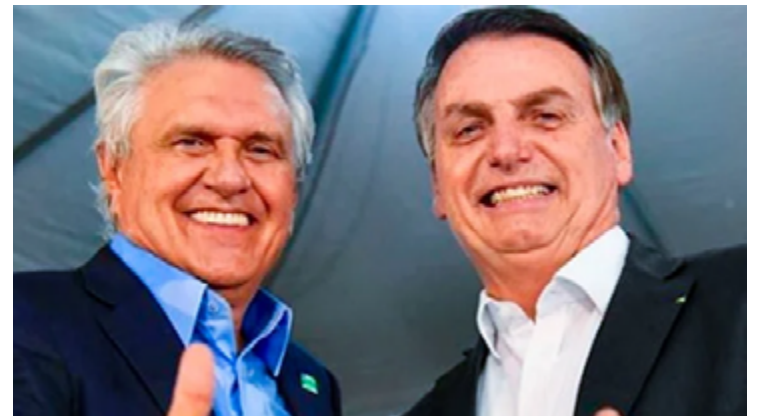
Ronaldo Caiado e Jair Bolsonaro: juntos no Rio de Janeiro