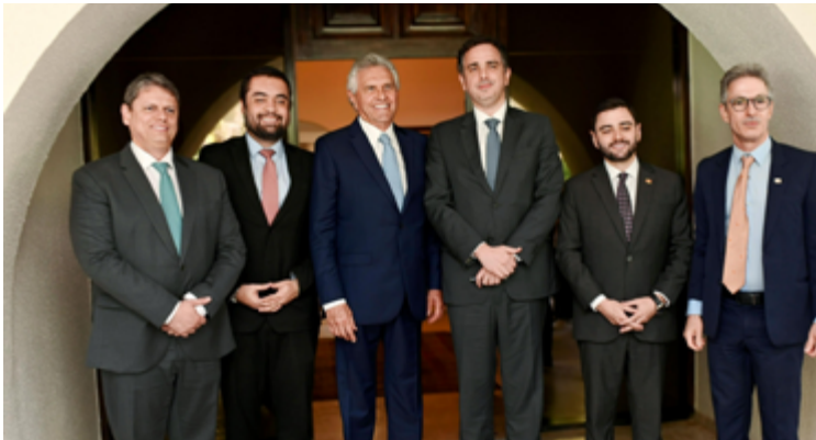
A reunião com o presidente do Senado, Rodrigo Pacheco, em Brasília, contou com a participação de governadores e representantes de outros quatro estados

Encontro de governadores e representantes de cinco estados com o presidente do Senado Federal resulta em acordo para apresentação de proposta de reajuste no IPCA ao Ministério da Fazenda