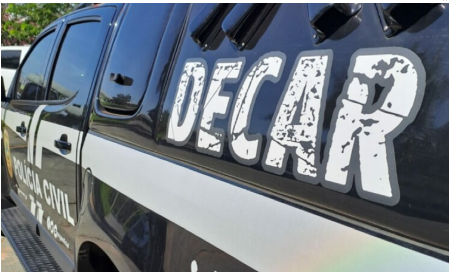
A Polícia Civil de Goiás, por meio da Delegacia Estadual de Repressão a Furtos e Roubos de Cargas, conduziu a Operação Bloqueador

A Operação Bloqueador demonstra o comprometimento da Polícia Civil de Goiás em combater atividades criminosas que impactam a segurança pública e a economia da região. A