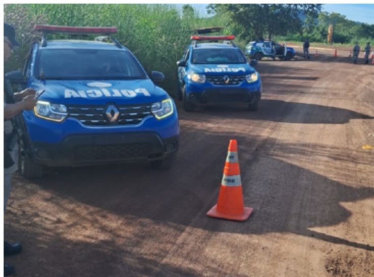
Polícia Militar impediu ocupação do MST em Vila Boa de Goiás: tática sem uso de violência

Além da tentativa de ocupação à Usina CBB, houve um caso similar no município de Itaberaí. A ocupação de uma área rural foi evitada após acordo entre o proprietário da terra e representantes do MST. A Secretaria de Segurança Pública (SSP) acompanhou o caso.