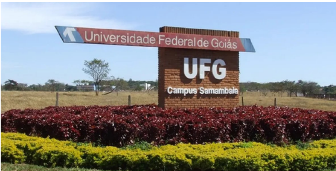
A mobilização dos servidores federais da educação, que inclui os técnico-administrativos em Educação, teve início em 11 de março

res federais da educação, que inclui os técnico-administrativos em Educação, teve início em 11 de março e ganhou adesão de diversos sindicatos de instituições de ensino su-