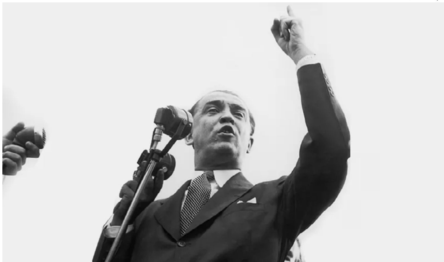
JK exerceu a presidência sob o lema de evoluir 50 anos em cinco, com plano de metas que modernizou o capitalismo brasileiro